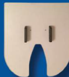
Inserto Wrap Around

(16" x 18" extra grande; non può essere utilizzato sulla GT-541)