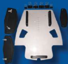
Inserto Piastra Cappello

(Stampa a corona e si utilizza sulla maggior parte dei cappelli)