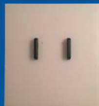
Inserto Piastra Grande

(Stampa a corona e si utilizza sulla maggior parte dei cappelli)